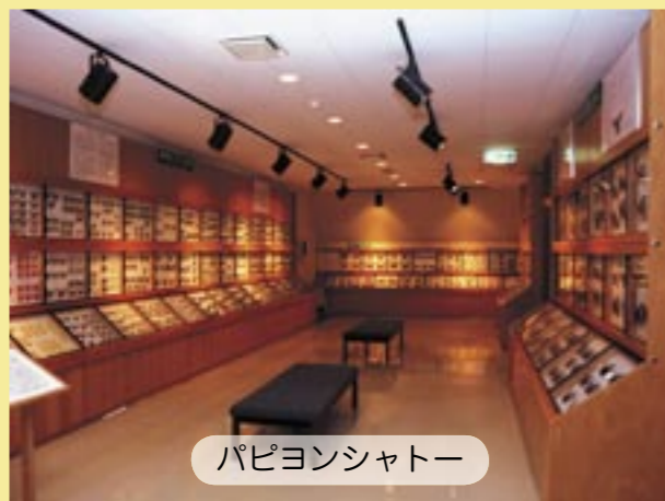
パピヨンシャトル