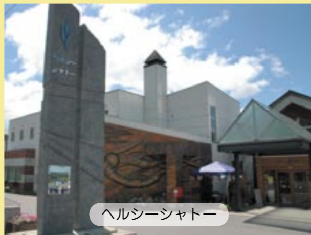
ヘルシーシャトル