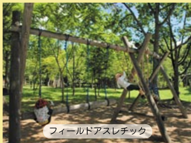
フィールドアスレチック